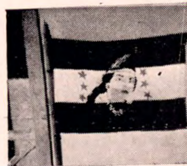
La bonita bandera que fue escogida por los vecinos del nuevo cantón de Nandayure.